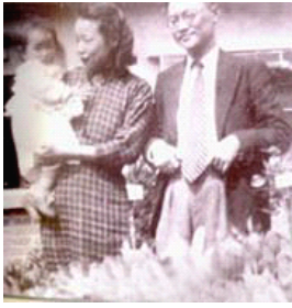
1947年春摄于上海复旦教工宿舍