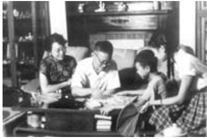
1962年，巴金全家在上海武康路寓所。左起萧珊、巴金