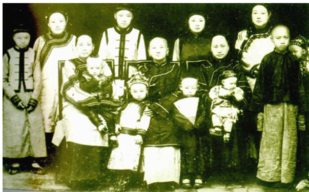
1907年全家福。左三为怀抱巴金的外婆，右三是巴金的母亲。

巴金（1904—2005），原名李尧棠、字芾甘，笔名佩竿、余一、王文慧等。祖籍浙江嘉兴，生于四川成都一个官宦家庭。中国文坛泰斗。五四运动中接受民主主义和无政府主义思潮。1920年入成都外国语专门学校攻读英语，参加进步刊物《半月》的工作，参与组织“均社”，进行反封建的宣传活动。1922年在《时事新报·文学旬刊》发表《被虐者的哭声》等新诗。1923年从封建家庭出走，就读于上海和南京的中学。1925年夏毕业后，经常发表论文和译文。1927年初赴法国留学，写成了处女作长篇小说《灭亡》，发表时始用巴金的笔名。1928年底回到上海，从事创作和翻译。从1929年到1937年中，创作了主要代表作长篇小说《激流三部曲》中的《家》，以及《海的梦》、《春天里的秋天》、《砂丁》、《萌芽》（《雪》）、《新生》、《爱情的三部曲》（《雾》、《雨》、《电》）等中长篇小说，出版了《复仇》、《将军》等短篇小说集和《海行集记》、《忆》、《短简》等散文集，其中1931年在《时报》上连载著名的长篇小说“激流三部曲”之一《家》，是我国现代文学史上最卓越的作品之一。其间任文化编辑，主编有《文季月刊》等刊物和《文学丛刊》等丛书。