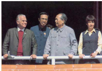
斯诺 1970 拜见毛泽东，敲开中美外交大门