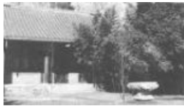
斯诺在燕京大学的住址

埃德加·斯诺(Edgar Snow)，(1905—1972) 美国著名记者和作家。生于美国密苏里州坎萨斯城一个出版印刷业主之家，1926年毕业于密苏里大学新闻系。1928年来到中国。曾任《密勒氏评论报》助理编辑、《芝加哥论坛报》驻华南记者、纽约《太阳报》和伦敦《每日先驱报》的特约通讯员。1929年应孙科邀请游历中国。1933年在北平燕京大学任教。