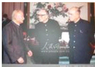
1984年，陈云、薄一波（中）、姚依林（右）在一起。

新中国成立后，任中央人民政府委员，政务院委员兼财政经济委员会副主任、财政部部长。1954年9月任国家建设委员会主任。1956年5月起任国家经济委员会主任、国务院副总理。同年9月当选为中共八届中央政治局候补委员。1959年4月、1965年1月两次继任国务院副总理，并曾兼国家经济委员会主任。“文化大革命”中曾因“六十一人叛徒集团案”遭受迫害。1979年7月出任国务院副总理。同年9月被增补为中共第十一届中央委员。1982年5月任国务委员，曾兼任国家经济体制改革委员会副主任。同年9月和1987年11月，两度被选为中共中央顾问委员会副主任。2007年1月15日20时30分在北京逝世，享年99岁。