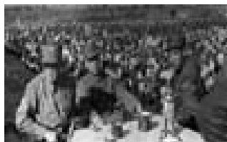
1946年，刘伯承、薄一波在战前动员大会上