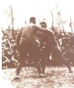
1938年薄一波和战士摔交

1928年底到天津，曾任中共天津市委兵委书记、北方局军委秘书长。1929年起，在天津、唐山和正太、平汉铁路沿线地区指导兵运工作，发动士兵暴动。1931年在北平被捕，关押在北平军人反省分院，在狱中曾任中共支部书记。1936年8月经组织营救出狱后，被派往太原任中共山西省工委书记。与山西地方实力派阎锡山达成从事抗日救亡工作的协议，参与领导山西牺牲救国同盟会，主办抗日军政训练班、民政干部训练班和国民党军官教导团，推动山西走向抗战。