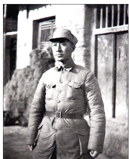
图为中共山西公开工作委员会书记、山西新军创建人、组织者和领导者薄一波在山西沁县。

在抗日战争时期，我个人主要在华北工作。1936年秋，在日寇步步进逼华北的危急形势下，山西地方实力派阎锡山为了保住山西的地盘，对付日寇的侵略，曾派人到北平来“营救”我出狱，当来人知道我还是共产党员，他认为阎锡山不会用真共产党员，立即报告了阎锡山。结果恰恰相反，阎锡山立即发来一份电报，大意是：目前山西形势危急，“希望一波兄回晋，共策保晋大业”。我拒绝了。但北方局刘少奇同志得知这件事后，认为机会难得，拒绝是不对的。他说北方局刚收到陕北来电，毛泽东同志在电报中提出：阎锡山等华北六省市军政负责人处，“一有机会，即须接洽。统一战线以各派军队为第一位，千万注意”。根据北方局的决定，我以抗日活动家的身份到了太原，与阎锡山达成协议，建立了特殊形式的统一战线。我们从山西实际出发，不怕戴“官办团体”的“帽子”、不提阎锡山不能接受的口号，接办、改组了由阎锡山担任会长的“山西牺牲救国同盟会”，与牺盟会中强大左派力量合作，开办各种抗日干部训练班，组织“国民兵军官教导团”，放手发动和组织群众，宣传党的抗日主张，站稳脚跟，抓住实权，为抗日战争爆发后八路军主力进入山西，打下了较