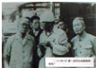
1983年8月，薄一波同志视察鞍钢炼铁厂