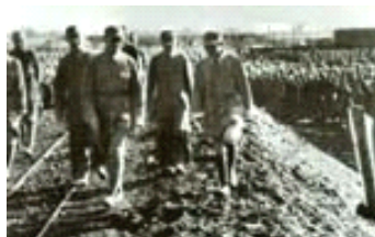
刘伯承、邓小平、薄一波、李达等检阅陇海战役参战部队。

抗日战争爆发后，于1937年8月建立山西新军“山西青年抗敌决死队”，任第一总队委。随即率部开赴晋东南地区，配合八路军开展抗日游击战争，参与创建太岳抗日根据地。1939年阎锡山发动十二月事变后，所部编入八路军第一二九师序列，任决死第一纵队司令员兼政委。1941年7月任晋冀鲁豫边区行政委员会副主席，8月任太岳纵队兼太岳军区政委。1942年10月后任中共太岳区党委书记、中共中央太行分局委员。1943年12月赴延安入中共中央党校学习。1945年6月当选为中共七届中央委员。抗日战争胜利后，任中共