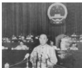
1949年薄一波在政治协商会议上的发言

晋冀鲁豫中央局副书记、晋冀鲁豫军区副政委。1946年7月，为保证刘伯承、邓小平率主力执行主要方向作战任务，与滕代远负责军区领导工作。1947年7月刘邓大军挺进大别山后，主持中共晋冀鲁豫中央局工作。1948年5月起任中共中央华北局第二书记、第一书记，华北军区政委，华北人民政府副主席。参与平津战役的组织工作，曾兼任平津卫戍区政委、绥远军区政委。