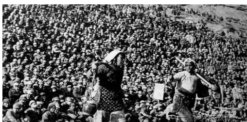
陕北秧歌剧《兄妹开荒》