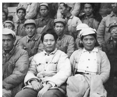
毛泽东与参加延安文艺座谈会的同志合影。

1942年2月1日，毛泽东在中央党校作《整顿学风党风文风》的报告，拉开了整顿“三风”的序幕。这是一次全党范围的生动活泼的马列主义教育运动。为了推进延安文艺界的整风学习，党中央决定召开一次文艺座谈会。座谈会之前，毛主席和有关中央领导同志作了大量调查研究工作。1942年5月2日，延安文艺座谈会在杨家岭中央办公厅召开。中共中央宣传部副部长凯丰主持会议。毛泽东在座谈会上发表了著名的《在延安文艺座谈会上的讲话》（“引言”），5月23日毛泽东又发表了“结论”部分的讲话。《讲话》根据马克思主义基本原理，科学总结了“五四”以来革命文艺运动的历史经验，创造性地提出我们的文艺是为人民大众的，首先是为工农兵的，为工农兵而