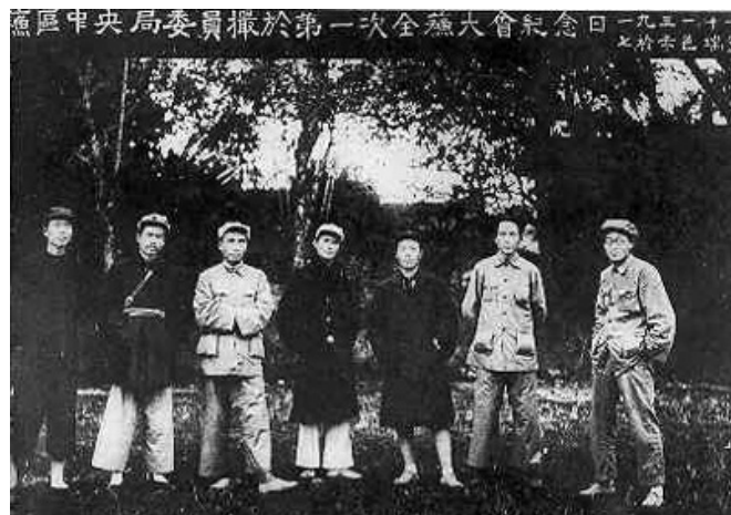
1931年11月，中共苏区中央局成员合影。左起：顾作霖、任弼时、朱德、邓发、项英、毛泽东、王稼祥

毛泽东在文中阐述的红色政权为什么能够存在与发展的原因和条件，以及“工农武装割据”的思想，正确回答了关系着中国革命前途和命