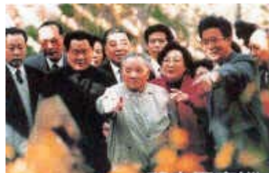
1992年初春邓小平南巡。

将召开的党的十四大上制定正确的路线和方针及其发展战略，以及选举新的中央领导集体时，迫切需要解决的问题。邓小平的南方重要谈话，就是为了适应历史