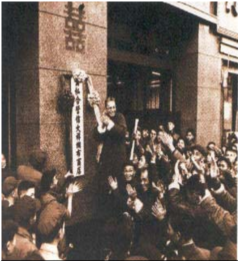
1956年1月，全国出现了全行业公私合营的高潮。

营企业，到1955年6月底，全国公私合营企业达2000多家。但是这种单个企业公私合营，不但进行速度慢，而且出现了合营企业和私营企业的矛盾，为了适应社会主义工业化和农村合作化迅速发展的需要，国家从1955年下半年开始试行全行业公私合营，1955年，毛泽东邀请中华全国工商业联合执行会执行委员会的委员举行座谈会。在会上，毛泽东就资本主义工商业的社会主义改造的前途和趋势作了分析，并提出了若干政策。